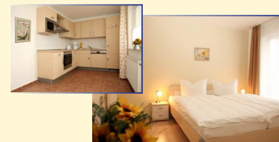
Wohnbeispiel Buskamp: Küche und Schlafraum