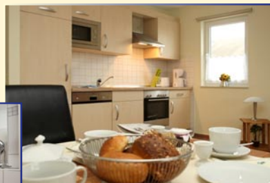
Wohnbeispiel Bernstein: Bad und Küchenzeile